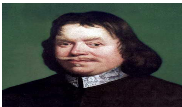
[John Bunyan, 1628-1688]

"But I observed that, although I was such a great sinner before conversion, God never burdened me heavily with the guilt of sins committed while I was in ignorance. He only showed me that I was lost if I did not have Christ because I had been a sinner. I saw that I needed a perfect righteousness to present me without fault before God, and this righteousness was nowhere to be found but in the person of Jesus Christ" (inthanete, 11-11-2021).